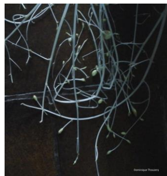
« graphisme » de pomme de terre