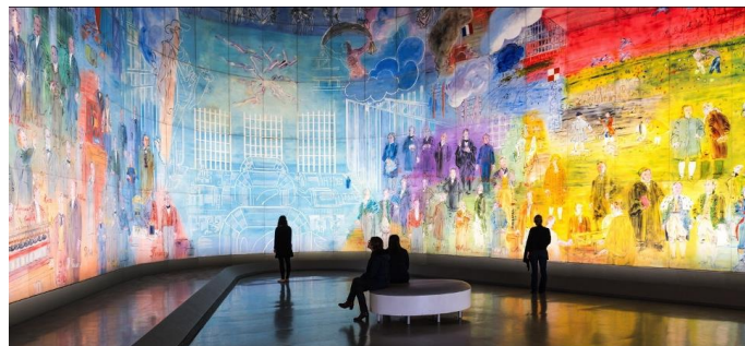
« La fée électricité » Raoul Dufy 1937