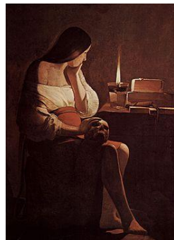
« Madeleine à la veilleuse » Georges de la Tour 1642/1644