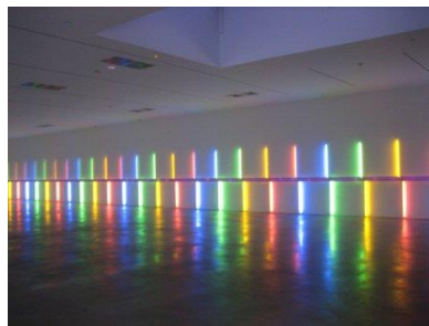
« Site-specific » installation Dan Flavin 1996

Pour travailler le graphisme en noir et blanc, on peut également s'inspirer de l'album